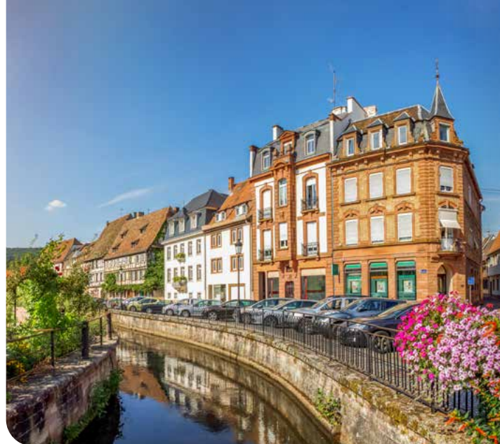
Reizvolles Altstadtflair in Wissembourg