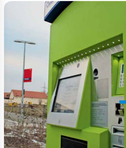
Bedienerfreundlicher vlexx-Automat für den Ticketkauf