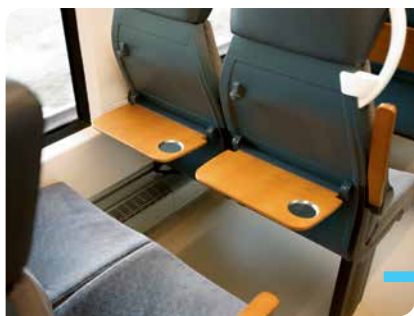
Zug für Zug barrierefrei und komfortabel