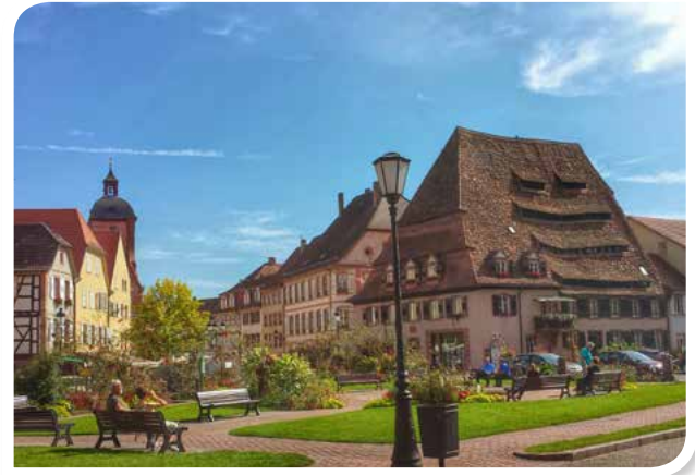
Reizvolles Altstadtflair mit Salzhaus in Wissembourg