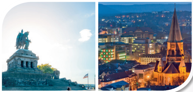
Der neue RE 17 – die kürzeste Verbindung zwischen Koblenz & Kaiserslautern